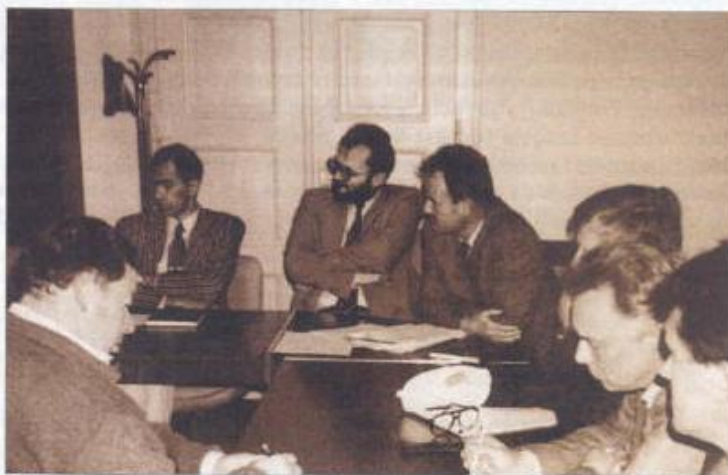
Sestanek vodilnih pripadnikov Manevske strukture Narodne zaščite na sekretariatu za ljudsko obrambo na Zupancičevi ulici v Ljubljani tik pred sprejetjem ustavnega amandmaja o Teritorialni obrambi 27. septembra 1990.

Prva in izredno pomembna ovira na poti do agresivnejšega reševanja tega vprašanja je bila zveznim organom Teritorialna obramba Republike Slovenije. Že dolgo pred tem časom je bila izpostavljena strahovitim pritiskom in mnogim poskusom preoblikovanja, katerega končni cilj je bil, da se podredi JLA. Po zaslugi odločnih protiukrepev republiškega vodstva do tega ni prišlo. Do takrat so se tem nečednim namenom zelo uspešno upirali. Čeprav se je v teh odnosih pričakovalo marsikaj neprijetnega, pa je med vse kot strela z jasnega udaril