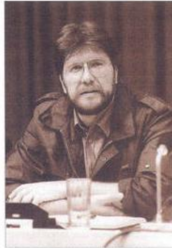
Igor Bavčar, takrat republiški sekretar za notranje zadeve

vor o nadaljnjem delu in medsebojnem sodelovanju.