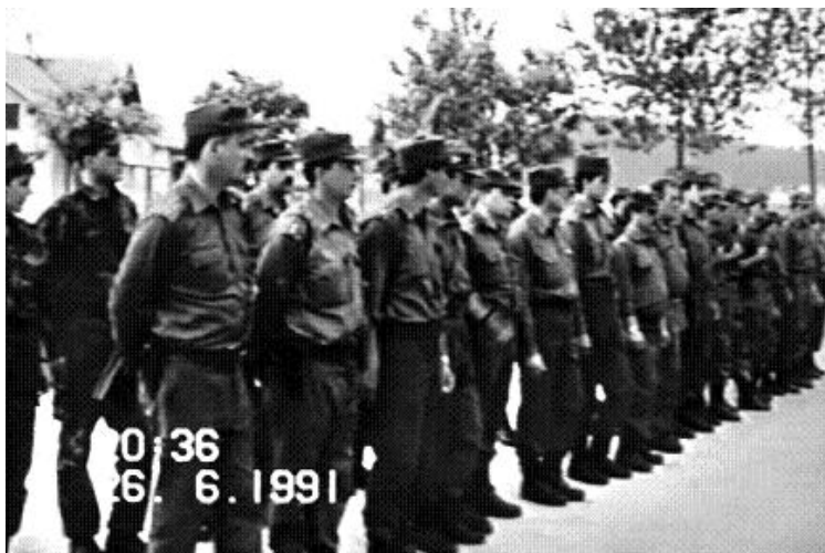
Postrojitev ob svečanem dvigovanju prve slovenske zastave pred Gasilskim centrom Grosuplje, kjer je imel sedež tudi 57. Območni štab teritorialne obrambe Grosuplje 26. 6. 1991 ob 20:35 ob proslavljanju razglasitve samostojne države Republike Slovenije.